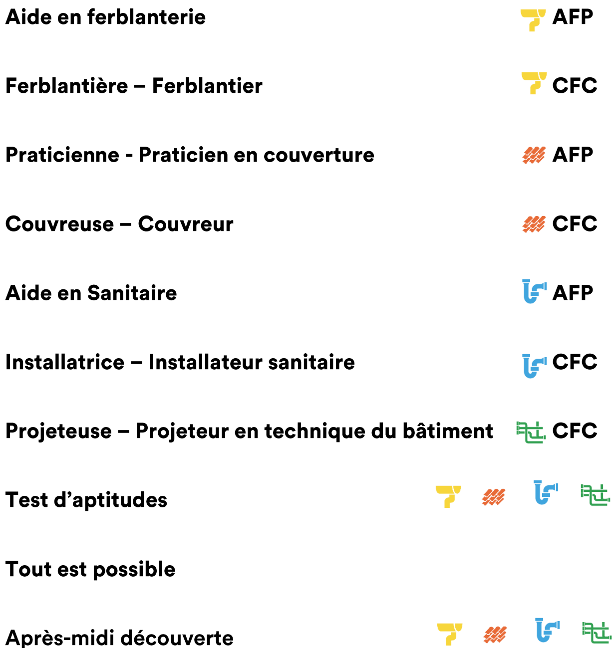
Table de matière